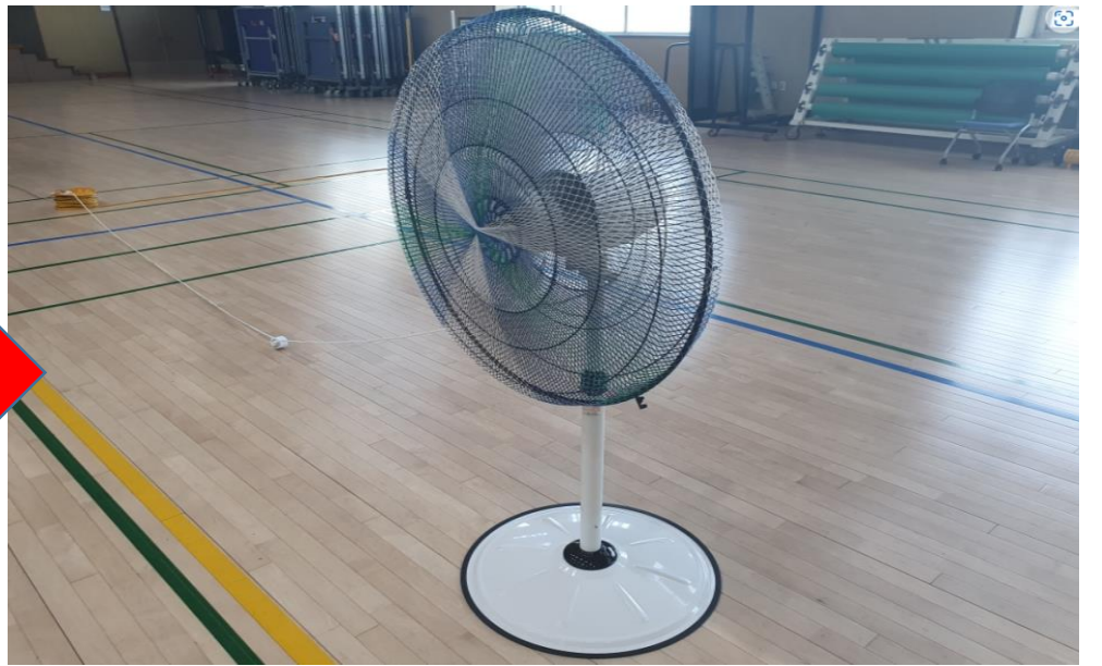
3층 다목적체육관 대형선풍기 교체 (7. 30.)