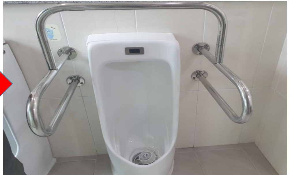
3층 남자화장실 장애인용 소변기 센서 교체 (7. 16.)